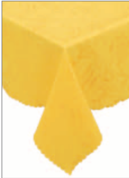
133 T GIALLO