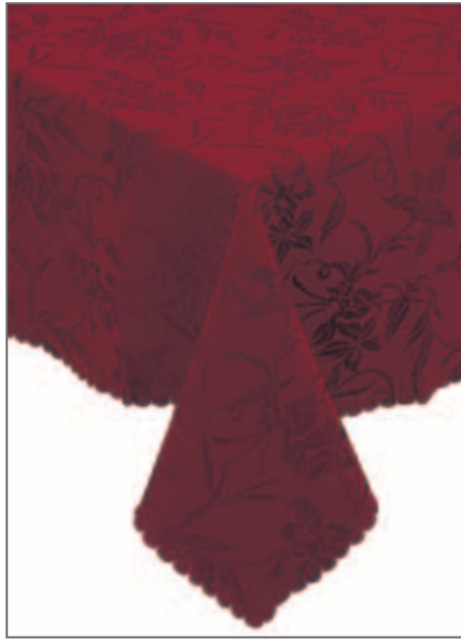
125 T BORDEAUX