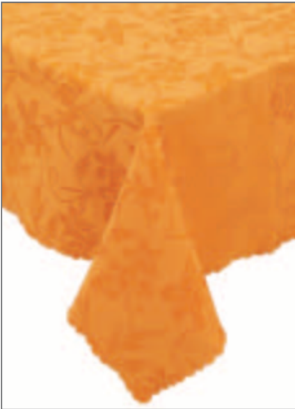
132 T GIALLO OCRA