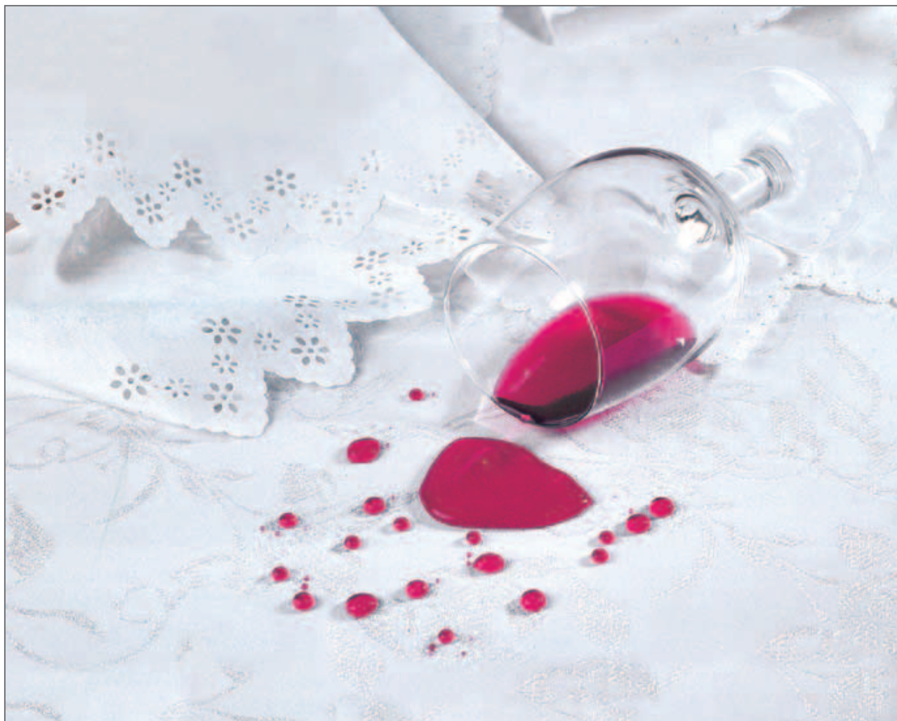
TOVAGLIA TABLE - CLOTH