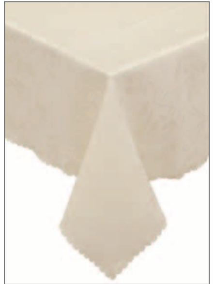
134 T PANNA