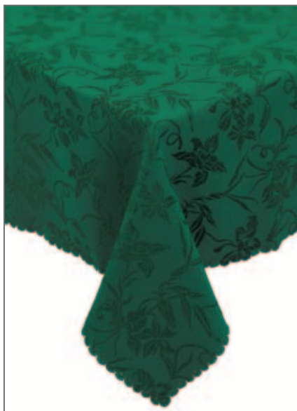
130 T VERDE