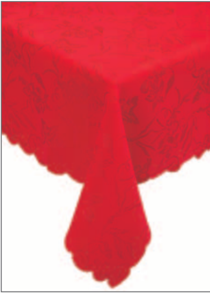
124 T ROSSO